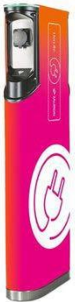
Rys.1 Przykładowa stacja ładowania o mocy 22 kW ładowania ING – Tauron Polska Energia S.A.

Okolice budynków użyteczności publicznej. Teatry, kina, baseny – to przykłady miejsc, dla których z dużym prawdopodobieństwem można określić godzinę zakończenia wykonywanej aktywności. Kierowca pozostawi pojazd do ładowania na zaplanowany, określony czas. Podobne lokalizacje, dla których przynajmniej w pewnym zakresie można regulować czas trwania aktywności, to cmentarze, banki, urzędy, salony fryzjerskie, centra miast itp. Office parki. Pomimo, że lokalizacja przeznaczona jest przede wszystkim dla pracowników i gości firm, punkt ładowania może być udostępniany publicznie wtedy, kiedy nie jest użytkowany, lub w określonych przedziałach czasowych w ciągu doby.